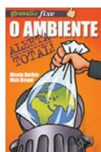
O AMBIENTE - ALERTA TOTAL Nicola Barker Nick Dewar Gradiva