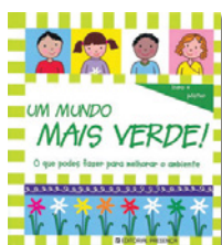
UM MUNDO MAIS VERDE! Jessie Eckel Editorial Presença