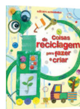
COISAS DE RECICLAGEM PARA FAZER E CRIAR Vários autores Educare Editora