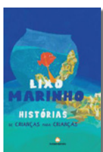
LIXO MARINHO Vários autores Plátano Editora