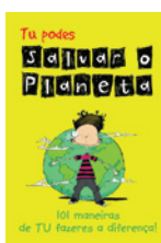
TU PODES SALVAR O PLANETA Jacquie Wines Sara Horne Editorial Presença