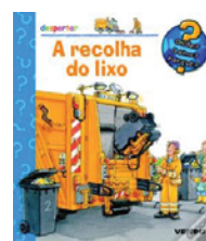
A RECOLHA DO LIXO Vários autores Verbo